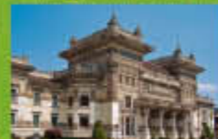
Fidenza Village a soli 17 km