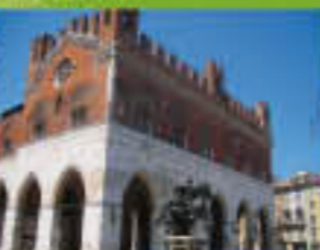
Chiaravalle della Colomba a soli 17 km