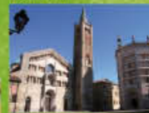
Busseto e le Terre venete a soli 14 km